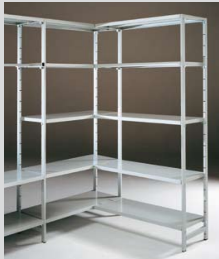
Esempio di composizione ad angolo