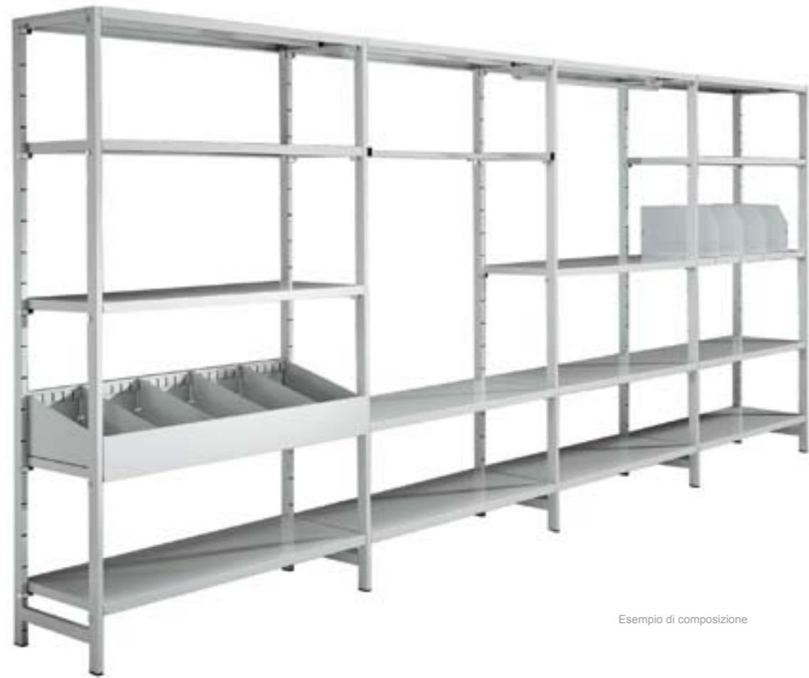
Esempio di composizione